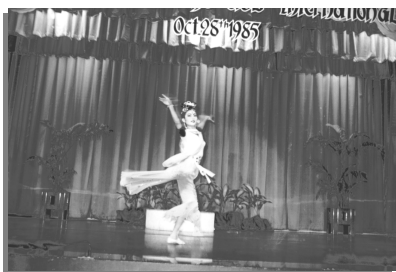
1985 年 10 月 28 日，为联合国妇女会在那莱大酒店演出跳舞《敦煌彩塑》剧照。