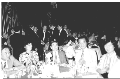
1985 年 10 月 25 日在 Royal Orchid Sheraton 五星级酒店参加庆祝酒会