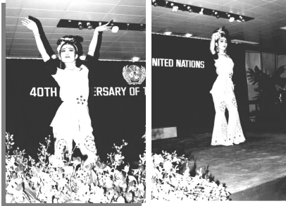
1985年10月22日，在亚太联合国总部演出舞蹈《敦煌彩塑》剧照。