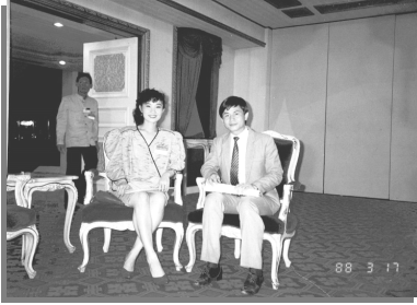
前中国驻泰国大使馆文化参赞秦裕森阁下，是当时活动的参与者。