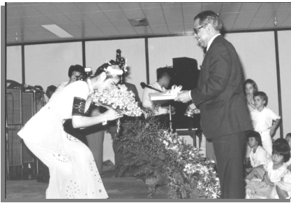
1985年10月22日，演出结束后上台接受联合国副秘书长献花。