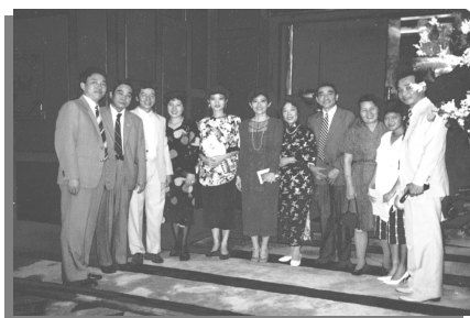
1985 年 10 月 25 日，中国出席庆祝酒会的嘉宾，在酒店礼堂门口合影。