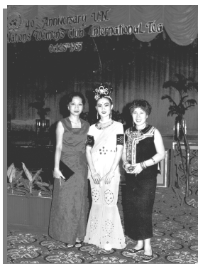
1985 年 10 月 28 日，在那莱大酒店，和参加联合国妇女会庆祝活动的嘉宾合影。