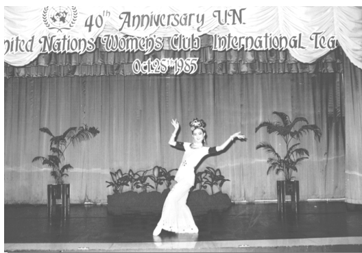
1985 年 10 月 28 日，为联合国妇女会在那莱大酒店演出舞蹈《敦煌彩塑》剧照。